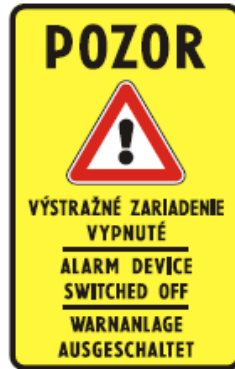
IP 30a Výstražné zariadenie vypnuté

43. V prílohe č. 1 I. diele I. časti bode 5 sa za vyobrazenie dopravnej značky č. IP 30 vkladá vyobrazenie novej dopravnej značky č. IP 30a: